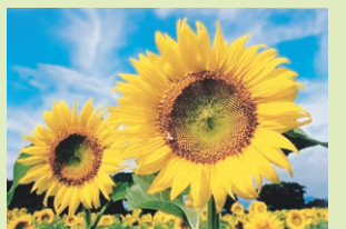
ひまわり写真コンテスト 最優秀賞「古里への誘い」

座間のヒマワリを題材にした小・中学生による写生作品(入選作品)の展示とひまわり写真コンテストの入賞作品を展示します。