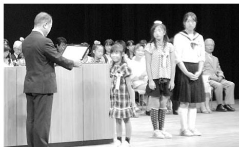
福祉作文最優秀賞の皆さん