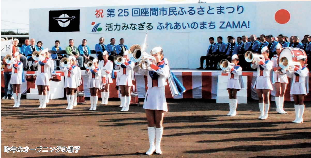
昨年のオープニングの様子

市民の皆さんとともにつくり上げる恒例の「座間市民ふるさとまつり」を、今年も座間中学校とふれあい広場などを会場に十一月六日に開催します。今年で二十六回目を迎えるこの祭りは、毎年多くの来場者でにぎわう本市を代表する祭りです。 さわやかな秋の一日、皆さんも家族や友人を誘い合って、魅力あふれるふるさとの祭りを堪能ください。 担当 座間市民ふるさとまつり 実行委員会事務局(市民協働課内) ☎046(255)27966 ☎046(255)3550