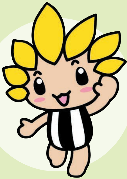
座間市マスコットキャラクター (名前は当日発表)