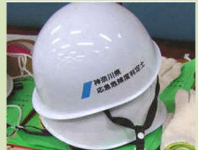
応急危険度判定士と 明示されているヘルメット