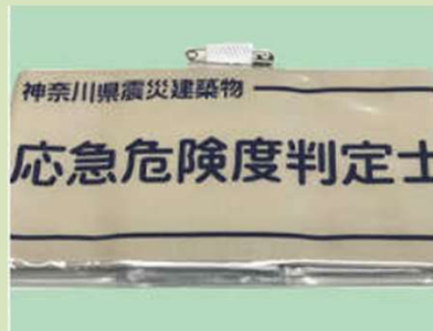
応急危険度判定士腕章