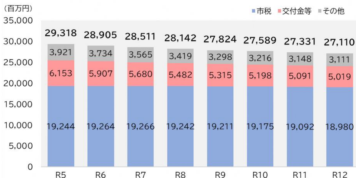
一般財源等の推計

今後の一般財源等は、新型コロナウイルス感染症や円安による物価高騰のような様々な要因に影響を受け、その度合いによって大きく変動する可能性があることを前提に試算した結果、微減傾向で推移していくものと見込んでいます。