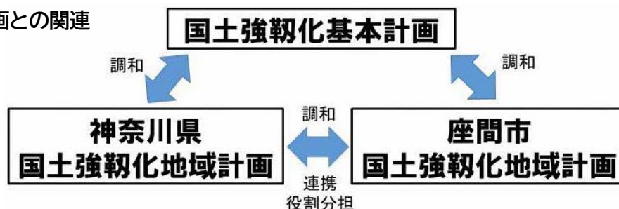
国・県計画との関連

なお、市地域計画における基本的な考え方、国土強靱化を進めるための方向性や具体的な取組内容は、ざま未来プランの基本構想を具現化するための事業計画である実施計画と併せて、市地域計画として策定します。