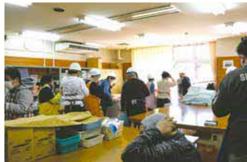
写真はいずれも令和3年度開催の同訓練の様子