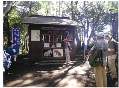
文化財ガイドの様子