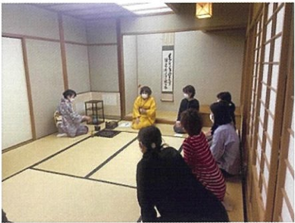
茶道体験教室の様子