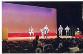
座間市民芸術祭民謡舞踊発表会