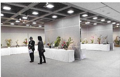
座間市民芸術祭いけばな展