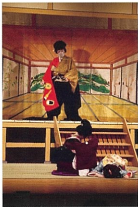
座間市民芸術祭入谷歌舞伎公演