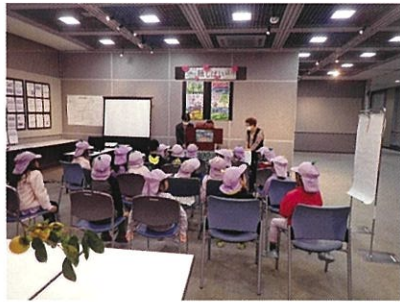
座間市民芸術祭「座間の歴史」展