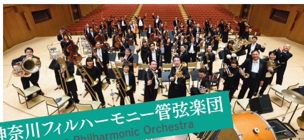
神奈川フィルハーモニー管弦楽団 Kanagawa Philharmonic Orchestra

これまでに、東京都交響楽団、新日本フィルハーモニー交響楽団、東京フィルハーモニー交響楽団、日本フィルハーモニー交響楽団、群馬交響楽団、東京佼成ウインドオーケストラ、神奈川フィルハーモニー管弦楽団、セントラル愛知交響楽団、富士山静岡交響楽団、ジョルジュ・エネスク・フィルハーモニー管弦楽団、ヤシ・モルドヴァ・フィルハーモニー管弦楽団などと共演、国内外で指揮活動を展開している。