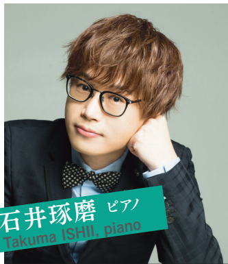
石井琢磨 ピアノ Takuma ISHII piano

「ザマ・プロムナードコンサート」はプロによる生演奏に触れ、その魅力を楽しんで頂く趣旨のもと、海老名市、座間市、綾瀬市文化振興プロジェクトの一環で行っております。今回は第2部に「クラシックをより身近に」がコンセプトに活動し、今最もチケット入手困難なピアニストの一人の石井琢磨を迎え、時代もジャンルも融合し新たなステージを示した曲「ラブソフィー・イン・ブルー」、第1部は、往年の映画音楽を素敵なナレーションともにお届けいたします。ピアノとオーケストラ奏でる多彩な音色をお楽しみ下さい。皆様のご来場を心よりお待ちしております。