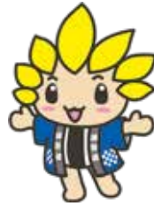
座間市マスコットキャラクター「ざまりん」

発行/座間市 編集/市長室市政戦略課 〒252-8566 神奈川県座間市緑ヶ丘1-1-1 ☎046(255)1111(代表) FAX)046(255)3550