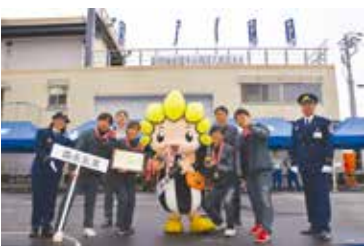
最優秀賞(屋内消火栓の部)