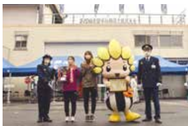
最優秀賞(消火器の部)