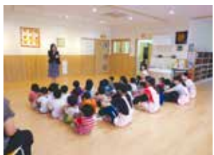
セレモニーの様子