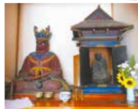
厨子の中の大日如来と閻魔大王