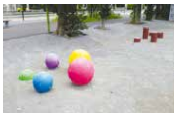
リニューアル工事完了後の同公園