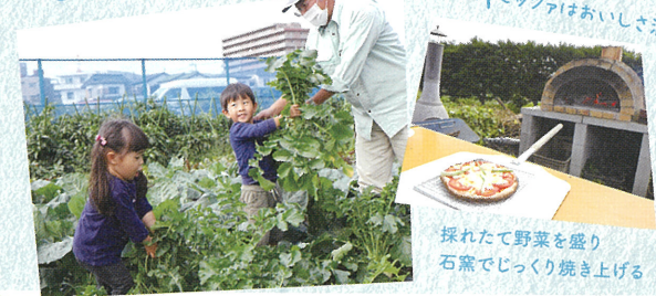
青空の下で食べるピッツアはおいしさ満点！