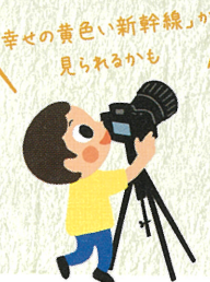
「幸々の黄色い新幹線」が見られるかも