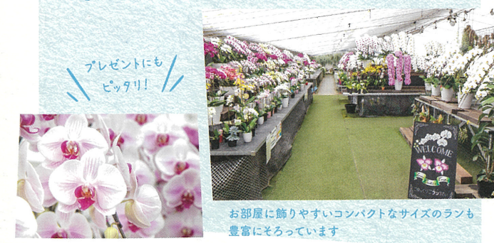
プレゼントにもピッタリ！