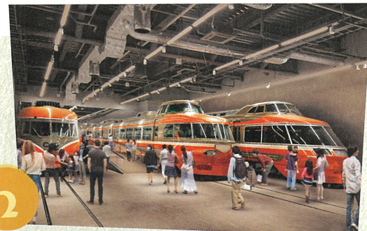
歴代の特急ロマンスカー車両が、間近で見られる貴重な場所