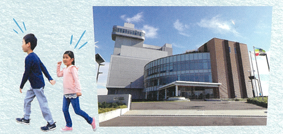
広大な施設内には、周辺の景色をぐるりと見渡せる展望室も！