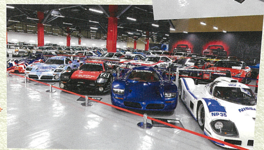
色とりどりのレーシングカーがスラリ。お気に入りの一台を見つけよう！