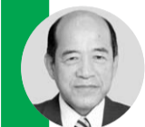
稲垣 敏治 議員《公明党》