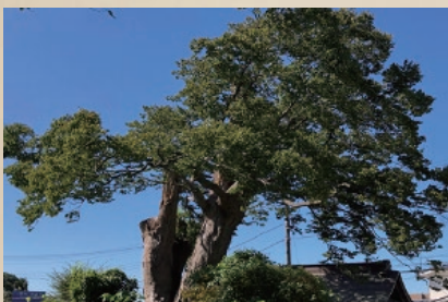
③護王姫社の大ケヤキ