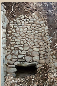
①梨の木坂横穴墓群