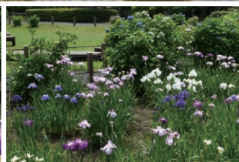
6月にはハナショウブ・アジサイが公園を彩ります