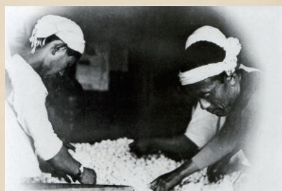
⑥繭の選別