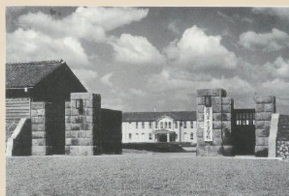
⑦士官学校正門