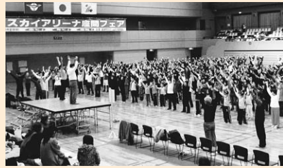
準備体操はみんなでいきます

今年で17回目を迎えるスカイアリーナ座間フェアは、座間高校創作舞踊部による創作ダンスなど自主的、継続的にスポーツ活動をするサークル（15団体16サークル）が日ごろの成果を披露する演技発表会です。