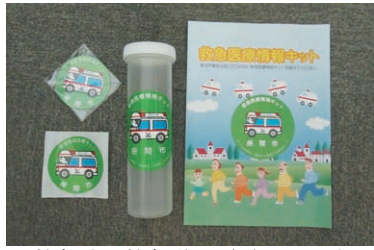
救急時に救急隊員が活用します