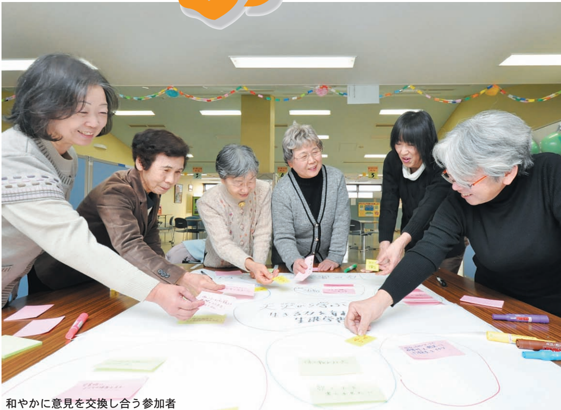
和やかに意見を交換し合う参加者

市と生涯学習フェスティバル実行委員会では、二月十五日(金)三月十五日(金)の期間でハーモニーホール座間(市民文化会館)、市図書館、市民館と野外施設などを会場として座間市生涯学習フェスティバルを開催します。 学びの持つ力を語り合うイベントや気軽に参加できる体験活動などが市内各地で開催されます。生涯学習活動の持つ力を語り合い、学びの持つ可能性を一緒に探りましょう! ※イベントの詳細は公共施設備え付けのチラシをご覧ください。 担当 生涯学習課 ☎046(252)8472 ☎046(252)4311