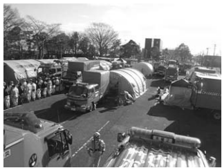
▲▼東日本大震災時に野営する緊急消防援助隊の神奈川県(上)と座間市消防本部(下)

市消防本部は、陸上自衛隊第四施設群と、合同野営訓練および災害対応訓練を行います。これは、発生から約一年六カ月が経過した東日本大震災を教訓に、異なる組織の資機材を検証するなど、いつ起きるか分からない災害に備えるためのものです。 皆さんもこの機会に、自衛隊や消防隊の野営施設を見学しませんか。 ○とき 十一月一日(木)