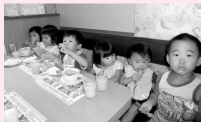
飲み物ももらって、子どもたちはご機嫌でした

皆さんは、「かながわ子育て応援パスポート」をご存じでしょうか。このパスポートを協力施設に提示すると、妊娠中や小学生以下の子どもがいる家庭は、お得な特典や子育て家庭にやさしいサービスが受けられます。座間市内には現在十三店舗の協力施設があります(二〇一二年九月十五日現在)。