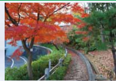
大坂台公園を鮮やかに彩る紅葉の様子

市の人口 ●129,778人 (-34人) 市の世帯数 ●55,614世帯 (+50世帯) 平成25年10月1日現在( )は9月1日との増減