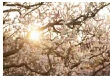
春の訪れを告げる梅の花 (かが沢公園)