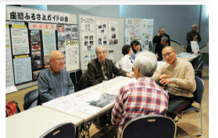
写真などを使ったわかりやすいブースで活動を紹介します