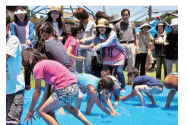
夏祭 アユ掴み取り

グリーントウン自治会は、座間市のほぼ中央を流れる目久尻川の両側に位置し、南北に細長く存在しています。初夏にはこの川に遡上してくる若アユを散歩がてらに見に来る人たちがたくさんいます。当自治会では、毎年初夏には子ども向けのアユの掴み取りとミニ防災フェア、夏には夏祭・夕涼み会、冬には地区社協と共催で餅つき会などで会員相互の親睦を深めています。また春・秋の美化デーと1月23日（シェイクアウト訓練時）の年に3回「一時集合場所」にて災害時の集合訓練と安否確認の訓練（参加率は毎回7割を超えている）を行ったり、その他、毎週1回自治会地域内の防犯パトロールを実施して安全・安心の住み良い街づくりに取り組んでいます。