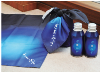
ざまみずとざまみず風呂敷

○内容 パネル展示、利き水体験、浮沈子工作教室、ざまりんと記念撮影など ※当日アンケートにお答えいただいた方に、座間の地下水100パーセントの「ざまみず」をプレゼントします。