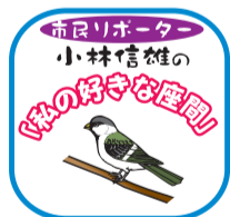
おいしい座間市の水道水

座間市の水道水を考えてみました。神奈川県の水脈は、丹沢連峰を頂点として東丹沢系と西丹沢系に分かれて相模湾に流れています。座間市は東丹沢系の相模川流域に位置しています。相模川流域の上流は、富士山麓の山中湖に端を発する道志川が相模湖に流れ、津久井湖を経て相模川へ流れています。座間市の湧水は、富士山東側の地下水（伏流水）が道志川沿いの