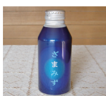
座間市特産品「ざまみず」

地下帯水層を流れ下り、相模原市の地下深層を数年か数十年を経て流れてくると考えられます。また、座間市地域に雨が降ると2～3カ月後には湧水が増えます。さらに、相模川の浄水も県水として水道水に含まれます。すなわち、座間市の水道水は、富士山からの伏流水と近隣雨水の浸透水と相模川の浄水との混合水と言えます。おいしい水道水の定義は、厚生省（現厚生労働省）が発足させた「おいしい水研究会」が示しています。座間市の水道水は、この定義にほぼ適合しており、地下帯水層の特性から