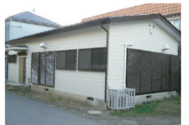
さがみ野自治会館外観

私たちの東原3丁目南自治会は、会員約90世帯で、美化デーを春と秋に実施し、その際、消防署東分署の協力を得て初期消火や防災の訓練を行っています。そして、毎月の地区連合防犯パトロール、龍蔵神社と栗原神社の例大祭や行事にも参加しています。地区の子ども会への援助を行い、子ども会美化デーなどに多くの子どもが積極的に参加してくれています。地区社協や東原コミュニティセンターにも協力しています。