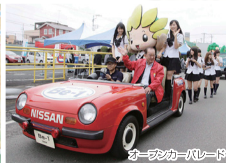
オープンカーパレード