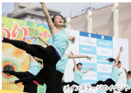
メインステージのイベント