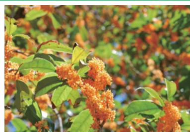
ハーモニーホール座間北側に咲く市の木モクセイの花