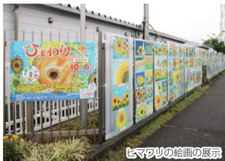
ヒマワリの絵画の展示