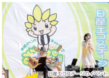
日産エコステージのイベント