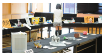
さまざまなアイデアの作品が並びます