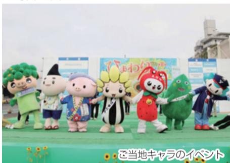
ご当地キャラのイベント