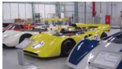
展示されている日産車

日産自動車(株)座間事業所では「ヘリテージコレクション(歴史的財産)」と題して、昭和初期の日産クラシックカーからレーシングカー、最新のEV車まで約350台が年代順に展示されています。年間見学者は5千名ほどいるそうです。説明を受けながら時代の流れが走馬灯のように脳裏を走りまわりました。初期のクルマにはエンジンにスターターがなく、手回しクランクでエンジンを始動させたこと、点火プラグを抜き取って磨いたこと、ラジエーターから蒸気が噴き出したことなど思い出しながら観望しました。