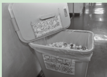
設置しているペットボトルキャップの回収ボックス

毎年行っている3年生の奉仕活動では、花壇の植え替えを保護者の方と協力して行い、卒業式には門出の道が花でいっぱいになりました。自然の素晴らしさに