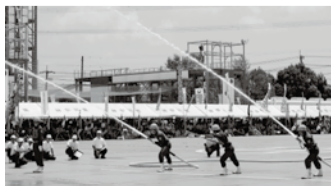
県大会で放水する市消防団

市消防団は、地域における消防防災のリーダーとして、いつ起こるかかわらない災害に対し訓練を積み重ねています。7月30日に行われた第49回神奈川県消防操法大会ポンプ車操法の部に市の代表として出場した第3分団は、日頃の成果を遺憾なく発揮し、最優秀賞を受賞しました。この競技は、ホースを延長し放水するまでの時間と士気、規律、迅速な行動などの正確性を競うもので、同分団は11月8日(土)に行われる第24回全国消防操法大会に出場します。