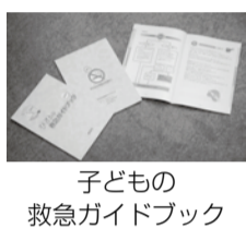
子どもの救急ガイドブック

夜間に子どもが急に発熱した場合には専任の相談員(看護師など)が電話で相談に応じていますので、ぜひご利用ください。