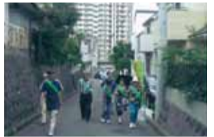
防犯パトロール中

緑ヶ丘地区自連に所属する緑ヶ丘6丁目自治会は、小田急線相武台前駅から座間駅方面に向かう線路沿いと、キャンプ座間に挟まれた所にあります。この地域は、小田急電鉄の宅地開発により発展してきた静かな住宅地です。当自治会としては、年間を通じて防犯パトロールや防災訓練、県総合防災センターの見学を実施して安心・安全な地域づくりに寄与し、環境美化の面からも桜並木の手入れを実施。また、統一美化デーの後には、「ふれあいの集い」を子ども会と共に開催し、ビンゴゲームなどは子ども達に人気があります。この地域も高齢化が進んでいますが、若い世帯も増えつつあり、会員同士の交流を大切にして、住み良い地域づくりに寄与したいと努力しています。