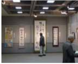
昨年度の展示(書道部門)