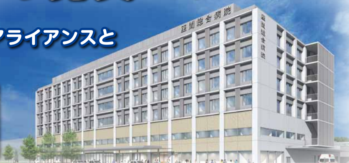
座間総合病院（地上6階）の完成イメージ図