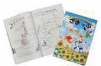
子育て情報が満載です

市では、子育てに便利な情報が詰まった子育て情報誌「ざまっぷ」を発行しました。「ざまっぷ」は、市内に在住する子育て中の母親が、編集委員として誌面の企画・取材・執筆をして作り上げました。