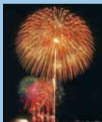
大小さまざまな花火が打ち上げられます