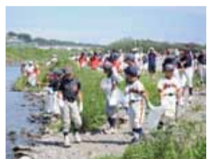
協力して川をきれいにします