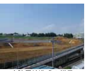
病院用地造成の様子 (平成26年7月15日現在)