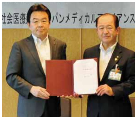
協定を締結するJMA理事長と市長

脳卒中・虚血性心疾患への対応については、血管造影装置などの高性能医療機器の設置や専門性の高い医師の確保に努める他、さらに消防職員が日中待機できる救急ワークス