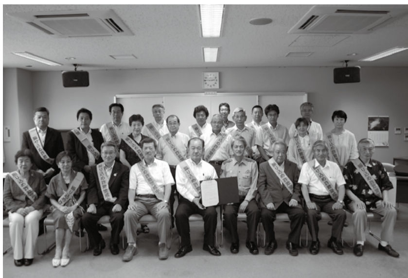
撲滅を宣言した座間市安全安心まちづくり推進協議会のメンバー