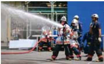
放水体験をする子どもたち