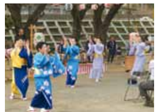
ふれあいまつりでの踊り披露

本年3月29日には桜の咲く明王第2公園で、星の谷社協と8自治会の協力により、多くのご来賓を迎え「ふれあいまつり」が盛大に実施され(おもち、味噌田楽、ポップコーンの無料配布、琴心流大正琴・おはやし演奏、ビンゴゲームなど)、谷戸にも春がやって参ります。