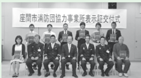
協力いただいている事業所の皆さん

市では、消防団活動に積極的に協力している事業所やその他の団体に対して、消防団協力事業所表示証を交付しております。5月10日、ハーモニーホール座間(市民文化会館)で消防団協力事業所表示証交付式を行い市内15事業所に、表示証を交付しました。これらの事業所は、特に従業員が消防団の活動を行うことに対して昇進、昇給などで不利に扱わないようにしていることや、勤務時間中に消防団の活動(出勤・訓練)を行った場合に賃金をカットしないなど特段の配慮をしている事業所です。消防団員は、年々減少傾向にあります。「自分たちの町は自分たちで守る」という思いで地域のために力を発揮してみたい方、随時募集しておりますので担当までご連絡ください。