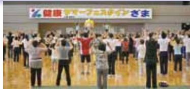
参加者全員での体操

市民が主体となって実行委員会方式で開催するこの催しは、健康に関するイベントが盛りだくさんです。ご自分の健康の確認や、健康づくりの輪を広げるため、気軽にご参加ください。