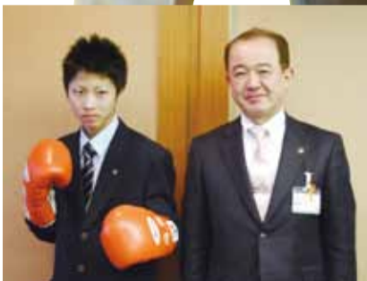
【平成22年4月14日】 世界ユース選手権への出場前に市長を表敬訪問(当時17歳)

1993年生まれ。市立栗原小学校・市立栗原中学校・相模原青陵高校卒業。 現在、栗原中央に父・母・姉・弟と在住