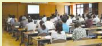
身近な環境について考える機会として、ぜひご参加ください