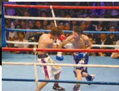
【平成25年8月25日】 スカイアリーナ座間(市民体育館)で日本王者に挑戦。見事勝利し、日本王座を獲得