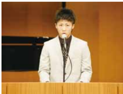
【平成26年1月13日】 座間市の成人1,347人の代表として、成人の誓いを述べる