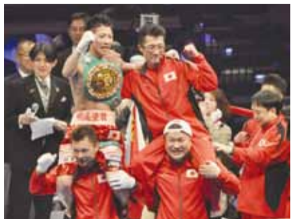
【平成26年4月6日】 世界タイトル戦に勝利し、世界王者に。4月16日には市役所前で市民の皆さんに報告