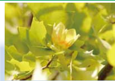
国際姉妹都市スマーナ市から贈られ たチューリップポプラ(市庁舎東側) ※写真は昨年のものです。