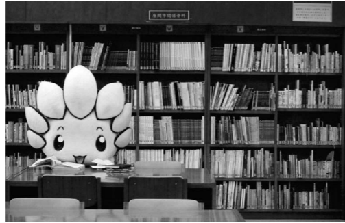
座間についての本がたくさんある、郷土資料のコーナー

調べて たのしい たくさん本を保管しているの で、いろいろなことを 調べられます。