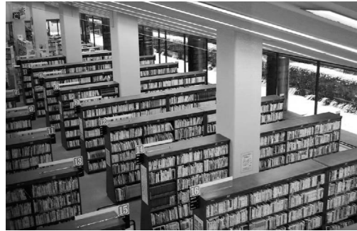
本屋さんとは違い、新しい本も古い本もある

調べて たのしい たくさん本を保管しているの で、いろいろなことを 調べられます。