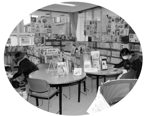
北地区文化センターの図書室

図書館以外にも、市公民館、北地区文化センター、東地区文化センターで本を借りることができます。また、図書館から本を取り寄せることもできます。