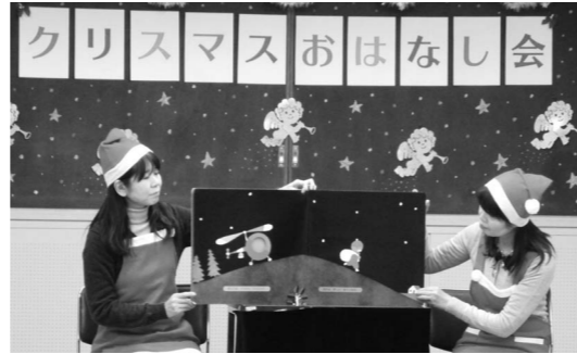
図書館で行われるイベントの様子

参加して たのしい 「おはなし会」や調べ学習の支援講座などのイベントを行っています。