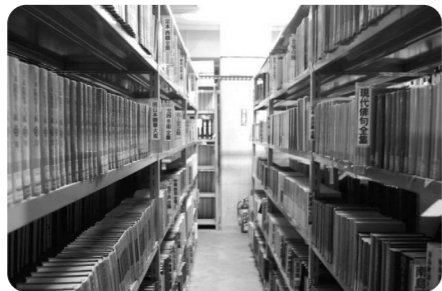
地下書庫には本がずらり