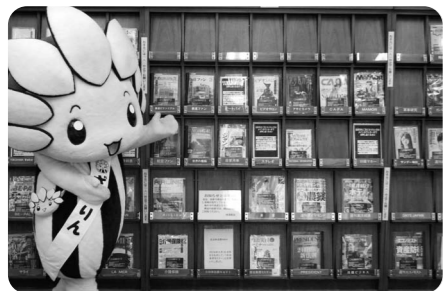
軽読書コーナーは約250タイトルの雑誌が読める