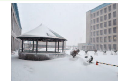
雪の降り積もった市役所 ふれあい広場