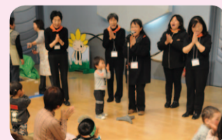
子育て支援団体によるイベント

イベントのスケジュールなど詳細は、公共施設で配布するチラシ、市ホームページまたは担当までご確認ください。