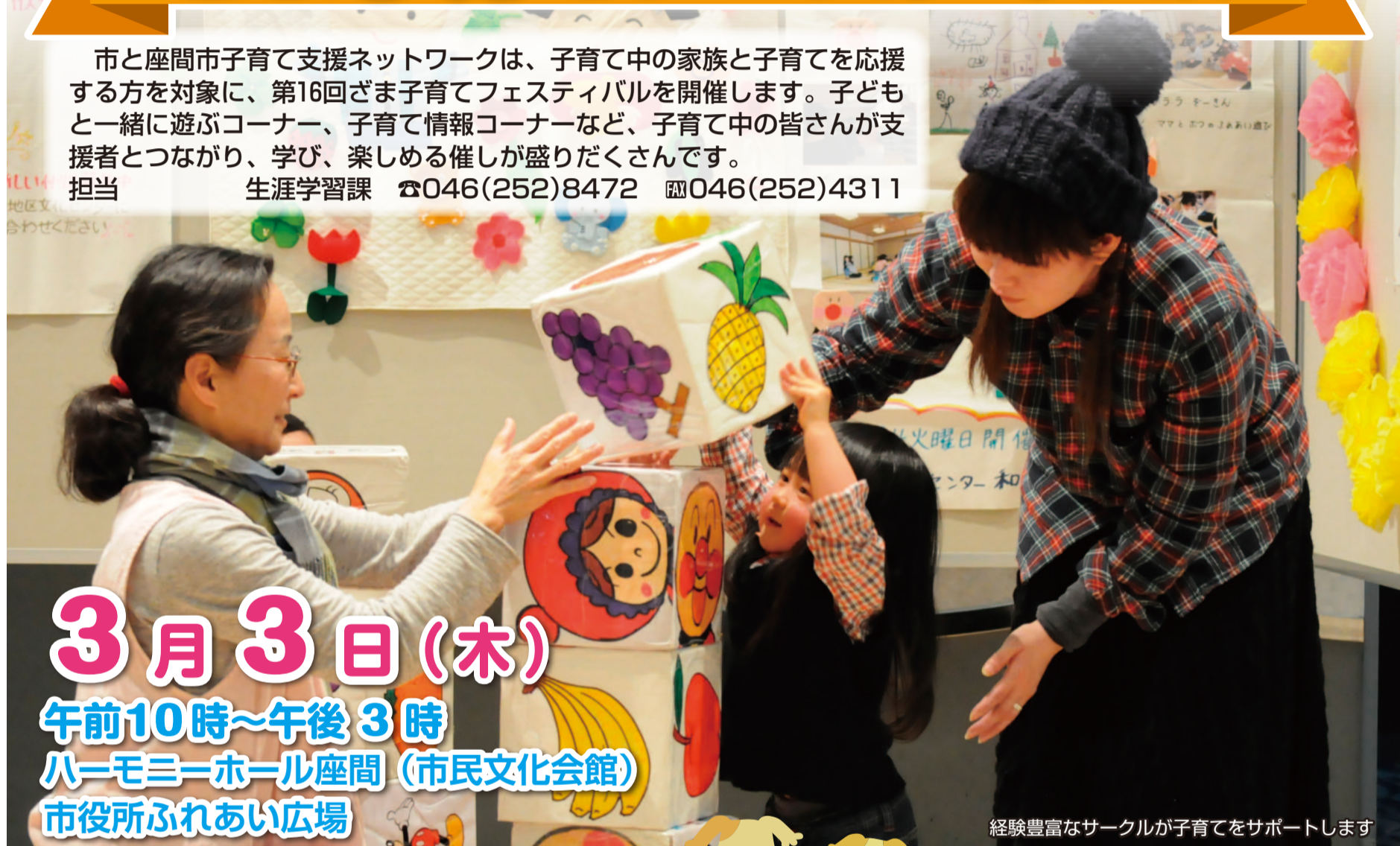
経験豊富なサークルが子育てをサポートします