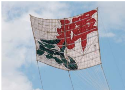
平成27年の大凧「輝風」

○応募方法 2月1日（月）までに凧文字（漢字二文字）、文字の意味・いわれ、住所、氏名、年齢、電話番号を明記し、〒252-8566座間市役所商工観光課宛てに郵送またはファクスで担当へ