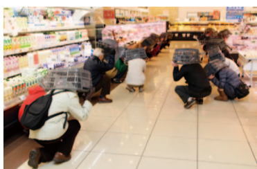
昨年の訓練の様子