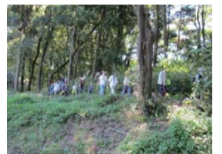
天候に恵まれたスタンプラリー

私は今回初参加で先頭の誘導役でしたが無事終えて安心しました。実行委員や多くの参加者の皆さま本当にお疲れさまでした。