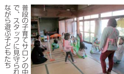
普段の子育てサロンの中で、スタッフに見守られながら遊ぶ子どもたち

座間市にはいろいろな地域や世代の方が気軽に喫茶を飲める場所として「あすなるの家」があります。ここでは、不登校の子どもたちの居場所づくりとしての「あすなる」や昨年5月にオープンした地域の子育て拠点としての「Coo育てサロンほつけ」があり、多くの方々が利用されています。