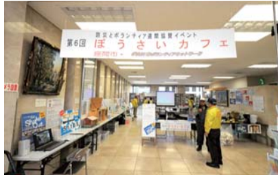
災害対策への理解を深めるきっかけになるイベントです