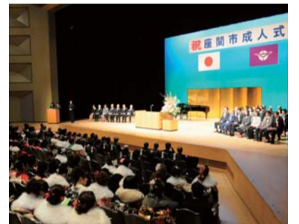
昨年の成人式会場