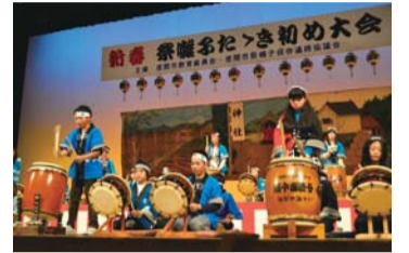
息の合った音色が会場を盛り上げます