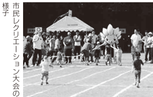
市民レクリエーション大会の様子

社会福祉法人 ユー・アイ・イー 特別養護老人ホーム 太陽の家 座間 お問い合わせは 【住所】座間市座間2丁目861-1【TEL】046-298-5133