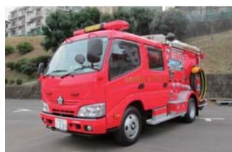
更新した消防ポンプ自動車

更新配備された消防ポンプ自動車は、旧車両に比べ、最新式のポンプを積載し、放水状態を随時確認できる電子パネルを採用することで、放水の操作・安全性が格段に向上しています。