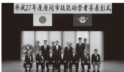
今回受賞された皆さん