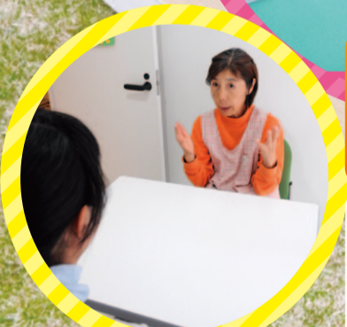
子育て相談に応じるアドバイザー