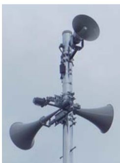
増設するスピーカー

現在、35カ所の子局で放送していますが、聞き取りづらい「難聴地域」を解消するため、防衛省の補助金を活用して15カ所の子局を増設し、12月15日（火）から放送を開始します。増設子局では、放送開始に備え試験放送を実施しますので、お聞き間違いのないように気を付けてください。