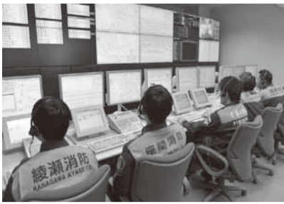
119番通報を受け付ける消防指令センター

消火・救急活動において、場所や状況を正しく伝えることができないと、消防・救急車の到着が遅れ、助かる命が助からなくなってしまうことがあります。慌てることがないように、11