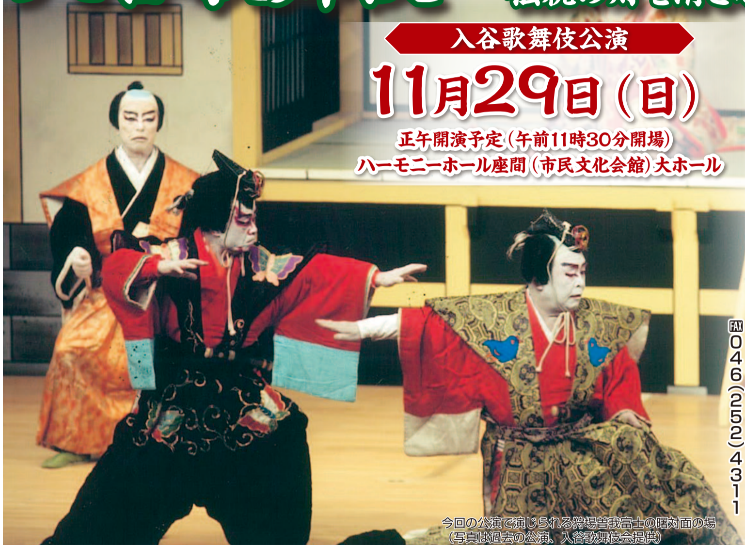
今回の公演で演じられる狩場普我富士の曙対面の場(写真は過去の公演)

市では、文化・芸術の発展および継承を目的に「市民芸術祭」を開催しており、10月から2カ月にわたり、21部門の発表を行います。 身近に文化・芸術へ触れることができるこの機会に、ぜひ会場へお越しください。 担当 生涯学習課 TEL 046(252)8476 FAX 046(252)4311