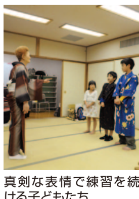
真剣な表情で練習を続ける子どもたち