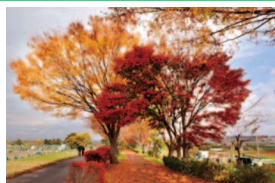
相模川沿いを彩る紅葉