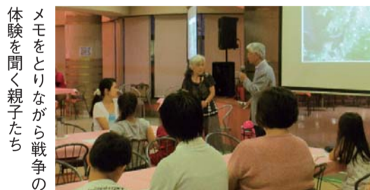
メモをとりながら戦争の体験を聞く親子たち

戦後70年という節目の年に、小学生の親子を対象にDVDや戦争を経験された方のお話を聞くことができる「平和勉強会」が開催されました。私も1年生の娘が少しでも戦争のことを考えるきっかけになればと思い、参加させていただきました。原爆の威力を学習する際、もし座間市役所が爆心地だったことを想定して自分の家はどのくらい被害を受けるのか学習しました。距離感がまだ