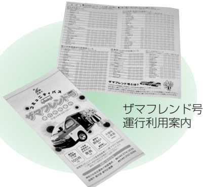
ザマフレンド号運行利用案内