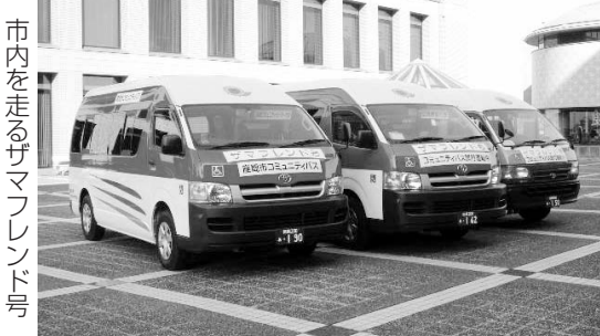
市内を走るザマフレンド号