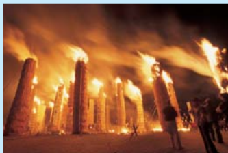
大迫力の松明あかし

座間市と友好交流都市協定を締結している福島県須賀川市では、11月14日(土)に松明あかしが開催されます。最大で高さが10メートルある大松明に火がつけられるこの祭りは、420年以上の歴史がある伝統行事で、日本三大火祭りに数えられます。