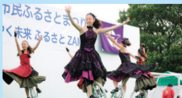
ステージイベント