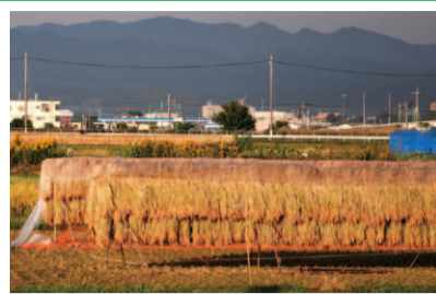
入谷駅西側から見た田園風景