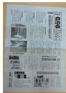
最新27号の自治会ニュース