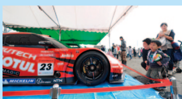
ヘリテージカーの展示