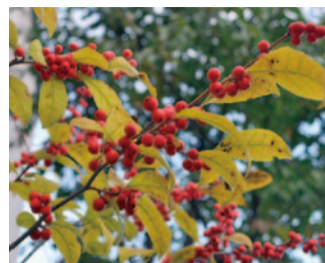
ハーモニーホール座間(市民文化会館)裏にあるナシ