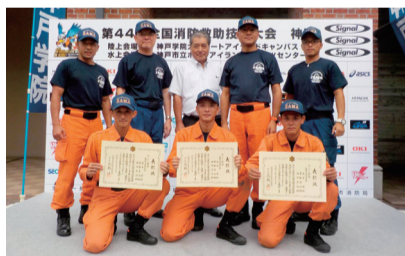
入賞を喜ぶ消防職員

8月29日に神戸学院大学ポートアイランドキャンパスで行われた第44回全国消防救助技術大会「ほふく救出」に県の代表として出場した市消防職員が、入賞を果たしました。