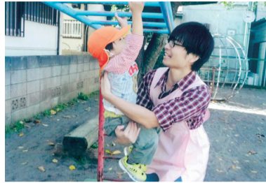
昨年の最優秀作品

育児を楽しむ父親（イクメン）・祖父（イクジイ）や家事に積極的に取り組む男性（カジ男）を撮影した「イ男フォトコン2015inZAMA」の写真作品を募集します。最優秀作品などには賞品を用意しています。詳しくは、市ホームページをご覧ください。