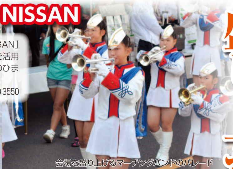
会場を盛り上げるマーチングバンドのパレード