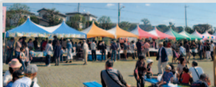
さまざまな店が立ち並ぶ模擬店