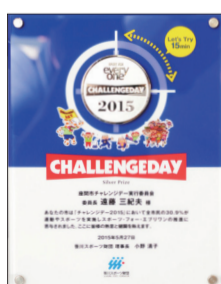
獲得した銀メダル

チャレンジデーは、人口規模がほぼ同じ自治体が15分間以上継続して運動した方の参加率を競うもので、対戦相手であった秋田県大仙市には及ばなかったものの、総人口の30.9パーセントの方が参加した座間市は、25パーセント以上50パーセント未満（人口7万～249,999人の自治体のカテゴリー）に与えられる銀メダルを獲得しました。