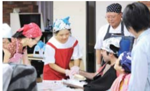
福祉施設でのうどん作りの手伝い

災害・救命編について 消防本部予防課 ☎046(256)2187 ☎046(256)3225 施設編について ボランティアセンター ☎046(266)2002 ☎046(266)1295