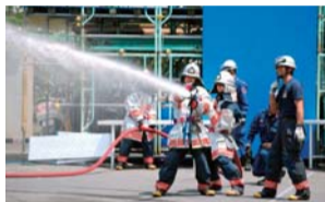
防火服を着ての放水体験