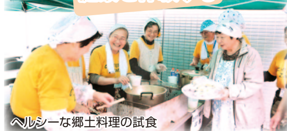
ヘルシーな郷土料理の試食