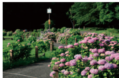
芹沢公園に咲くアジサイ