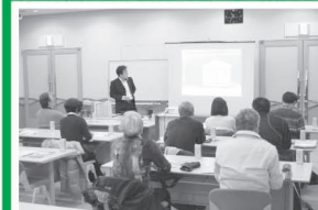
▲各地区でも好評の少人数勉強会

【日時】6/28(日)午前10時～(約1時間半) 【場所】ハーモニーホール座間2階会議室