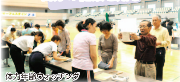
体力年齢ウォッチング