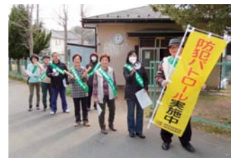
巡回中の防犯パトロールメンバー

明王自治会は、入谷第一地区自連(星の谷連合)内では一番北側で相武台の近くに位置します。この地域としては歴史が浅く、44年目(会長は歴代17人目)です。現在、役員10人中5人が子育て世代で、3年の歴任で活躍しています。全390戸中、約240世帯が自治会に加入しています。今年で7年目に入った防犯パトロールは、月に2回(第2・第4日曜日)、二つの班(全19班)の持ち回りで実施し、年間述べ240人以上が参加し、2コースに分かれ巡回します。地域的にも恵まれ、自治会内に3公園があり、近くには県立座間谷戸山公園、富士山公園もあります。今後も住み良く安全・安心で魅力ある町づくりに全員で取り組みます。