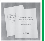
▲「塗り替え工事で失敗しない小冊子」を進呈

「いつかはやらなくてはいけない塗装工事」 「外壁・屋根塗装は、業者に一任せざるを得ません。そのため手抜き工事や料金トラブルが報告されています。正しい知識でトラブルを防ぐための勉強会です」失敗しないためのノウハウが満載。参加者に『塗り替え工事で失敗しない小冊子』を進呈。事前予約を。