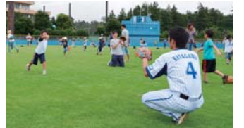
元プロ野球選手の指導を受ける子ども