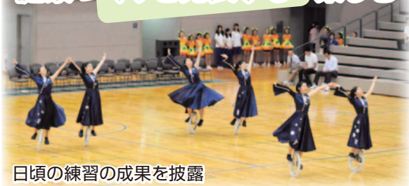
日頃の練習の成果を披露