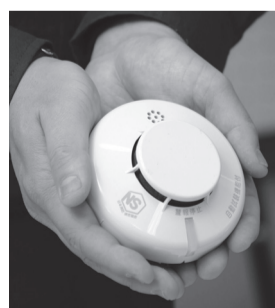
一般的な住宅用火災警報器

住宅用火災警報器は、煙や熱を感知して火災の発生を警報音や音声により知らせるもので、平成23年6月1日から設置が義務付けられています。火災警報器は、消防設備取扱店の他、電気店やホームセンターなどでも取り扱っていますので、設置していないご家庭は、早めに設置をしてください。