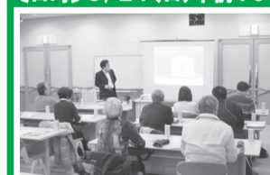
▲各地区でも好評の少人数勉強会

【日時】5/24(日)午前10時～(約1時間半) 【場所】ハーモニーホール座間2階会議室