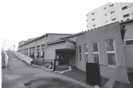
「東原4丁目」交差点のすぐそば