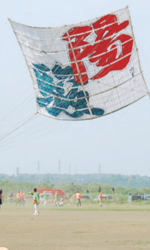
大空を舞う昨年の大凧「陽駿」