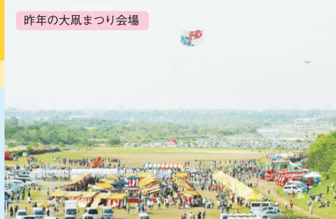
昨年の大風まつり会場

担当 大風まつり実行委員会事務局（商工観光課内） ☎046(252)7604 ☎046(255)3550