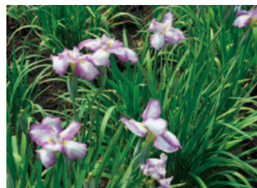
立野台公園に咲くハナシヨウブ