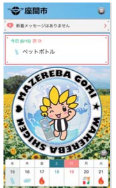
トップページ画面