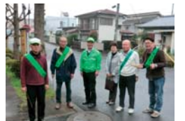
防犯パトロール隊

自治会は、地域住民の安全・安心と地域の発展のため、日頃からさまざまな活動に取り組んでいます。この連載も、多くの自治会員の皆さんの活動に支えられています。自治会への加入などは、自治会総連合会事務局 ☎046(252)8751までお問い合わせください。