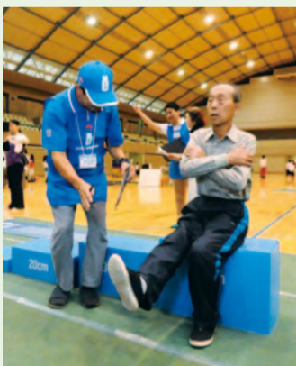
介護状態になる可能性がチェックできる「ロコモ度テスト」