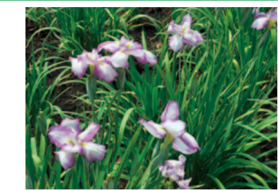
立野台公園に咲くハナシヨウブ