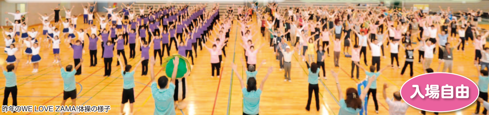
昨年のWE LOVE ZAMA!体操の様子