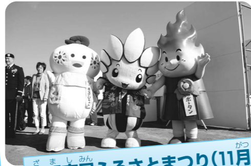
座間市民ふるさとまつり(11月)

ざまりんのお仕事は、 座間市の魅力を全国に 紹介することなんだ！ みんなざまりんのこと と応援してね！