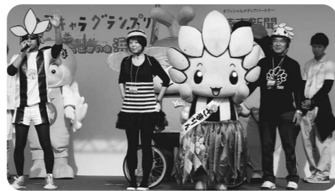
ゆるキャラ®グランプリでPRしたよ！