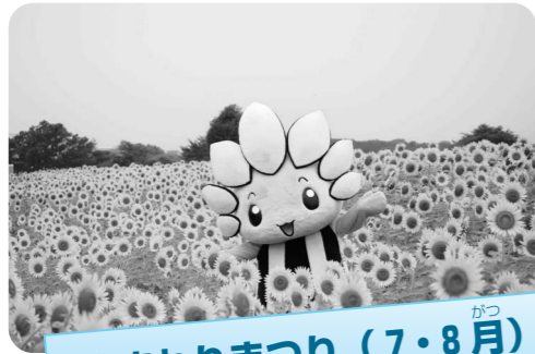
ひまわりまつり (7・8月)