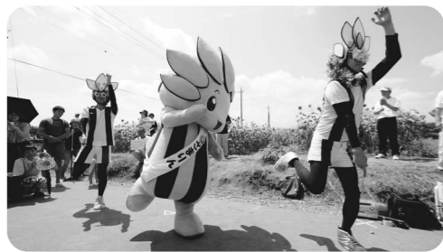
親衛隊と「ざまりん」を一緒に踊ったよ！