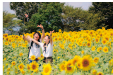
座間会場のひまわり畑