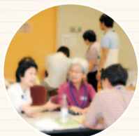
教室は交流の場にもなっています

地域活動や趣味へ積極的に取り組み、意識的に外出を増やすように心がけましょう。歩数計などを使い日々の活動量を把握することをお勧めします。