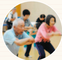
地域の運動サークル

有酸素運動(ウォーキングなど)と筋力トレーニングを組み合わせることで足腰の衰えを予防することが大切です。