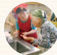
地域の料理サークル

栄養について学ぶとともに、飲み込む機能を維持する口や舌の体操を行い、食事を楽しくするようにしましょう。口の健康は、転倒や認知症と関連があるといわれています。