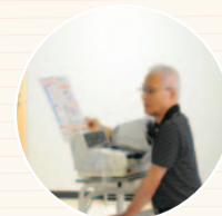
公共施設の測定器を利用する教室の参加者

市民健康センターの「健康度見える化コーナー」や定期健診、市のがん検診などを活用しましょう。