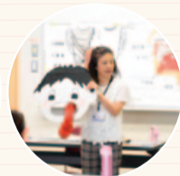
歯つらつお食事講座