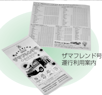
ザマフレンド号運行利用案内