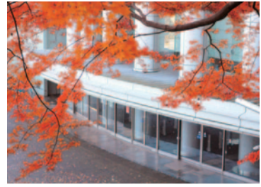
色づいた大坂台公園の エッセ

市の人口●128,880人(-4人) 市の世帯数●56,591世帯(-9世帯) 平成28年11月1日現在( )は10月との増減