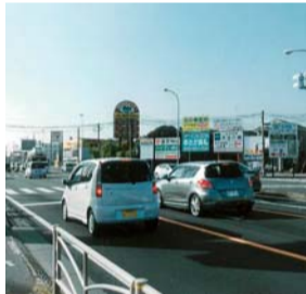
交通量の多い国道246号線

った男性はびっくりして大声を上げていました。「子どもが乗っているのに危険運転をするなんて」と思っていると、同じ交差点に大型のダンプカーが近づいてきました。ドキドキしながら交差点を注視していると、その車は、スピードを落として止まり、男性が横断歩道を渡るのを確認してから発車しました。 その時、車体に「安全運転は私の命です!!」と書いてあることに気付き、うれしくなりました。私も安全運転を続け、市内の子どもたちに安全運転の大切さを伝えていきたいです。