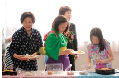
ポットラックランチパーティー

外国籍の方との交流を目的として、民族音楽・舞踊の披露、ポットラック（持ち寄り）ランチパーティーなどを行う、無料の「座間市国際交流フェスティバル」を開催します。知り合いの外国籍の方などをお誘いの上、ご参加ください。