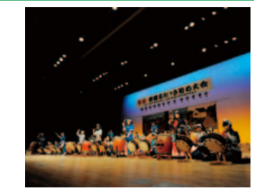
新春を祝う祭囃子の演奏 (新春祭囃子たたき初め 大会)