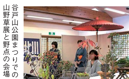
谷戸山公園まつりでの山野草展と野点の会場

公園のパークセンターでは、山野草展と野点が開催されました。山野草展では野山のかわいらしい草木の鉢植えを鑑賞できました。その隣では市の茶道連盟による野点が開催されていて、朱傘の舞台で和装の女性が抹茶と和菓子を来場者へ呈わっていました。