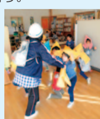
「プラス1」の避難訓練