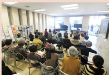
1月のロビーコンサートの様子