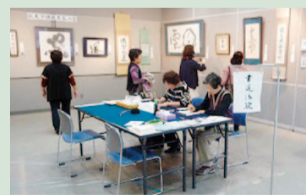
ハーモニーホール座間(市民文化会館)で開催した書道体験の様子