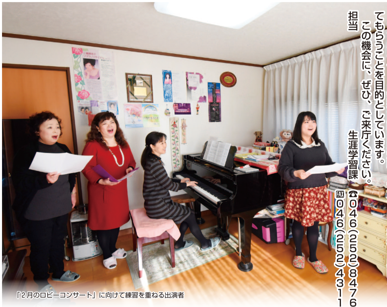
「2月のロビーコンサート」に向けて練習を重ねる出演者

市役所で芸術を 体感しよう 市では、来庁者の皆さんに気軽に音楽や書道、将棋などに触れてもらうべく「ロビーコンサート」や「ロビーイベント」を開催しています。 いずれの催しも無料で誰もが気軽に参加でき、芸術に興味をもってもらうことを目的としています。 この機会に、ぜひ、ご来庁ください。 担当 生涯学習課 ☎046(252)8476 ☎046(252)4311