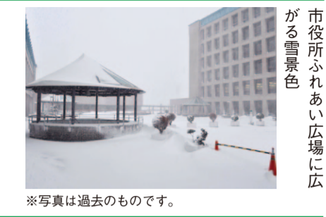
市役所ふれあい広場に広がる雪景色