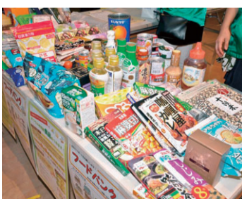
フードバンクに集まった加工食品

いないもの（外装は可）です。現在、子どもの支援のため食料品ではありませんが、乳幼児のおむつや授乳用のパッド寄贈も受け付けているそうです。ご家庭で眠っている加工食品やサイズが大きくなり使えなくなったおむつ、卒乳や断乳となり余った母乳パッドはありませぬか。私たちが気に掛けることによって、一人でも多くの子どもたちやその家族が辛く悲しい思いをせずに住める座間市であって欲しいと思えました。