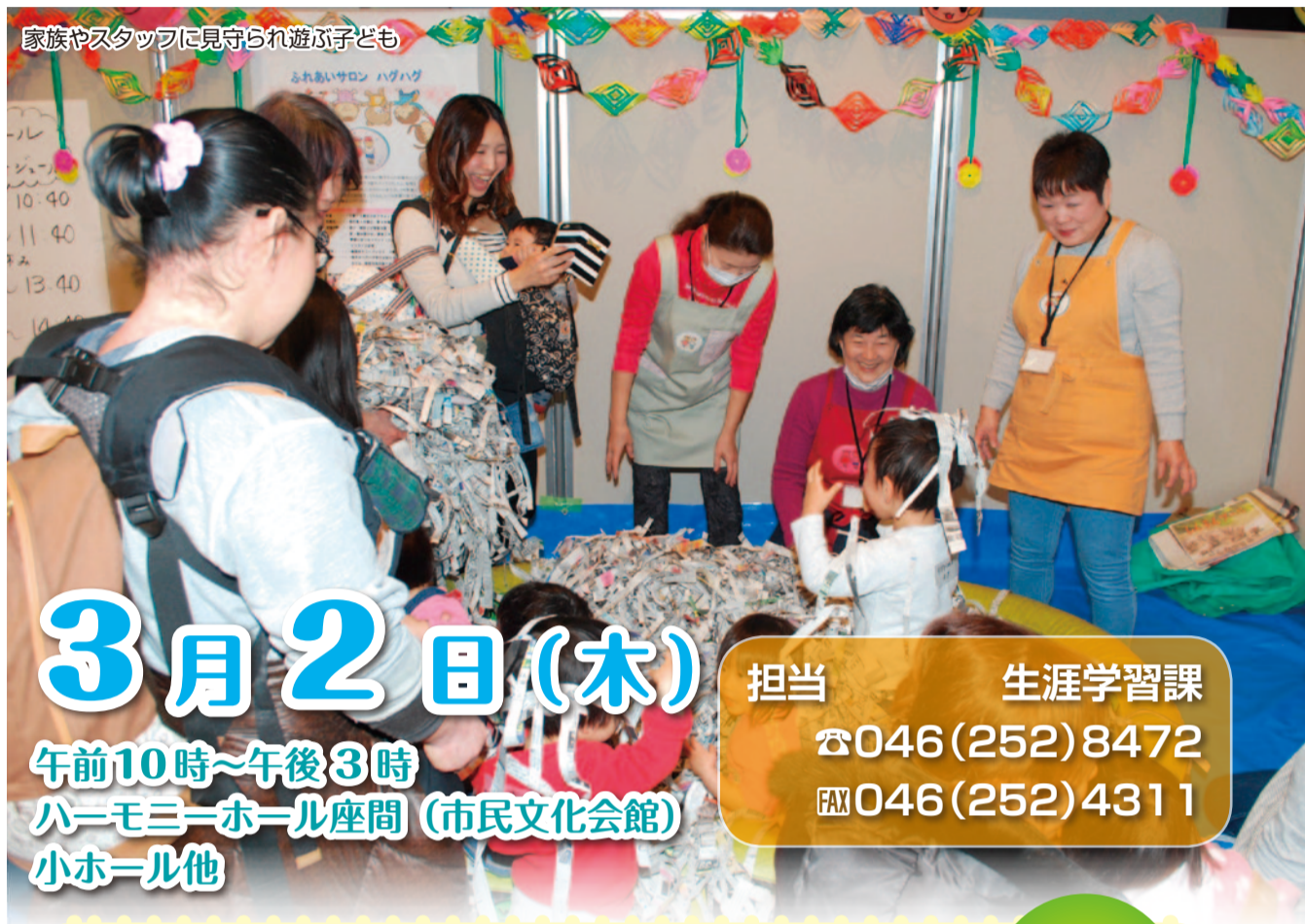
家族やスタッフに見守られ遊ぶ子ども