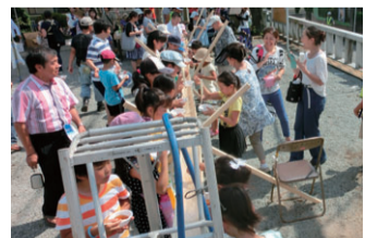
30メートルもある「そうめん流し」

芹沢連合自治会は4自治会からなり、水源地区や芹沢公園など住民にとっては貴重な散策コースがあります。隣近所の交流が少なくなってきている現状から、誰とでも挨拶できる雰囲気づくりを目指しています。また、自治会区域の中央にある山王神社の境内が去年から2倍の広さになり、いろいろな催しができるようになりました。どんど焼きは昔、道祖神前の道路上で行われていましたが、何度か場所が移り、現在の場所に落ち着きました。去年の七夕祭りでは、住民350人ほどで「そうめん流し」を楽しみました。今年は桜の満開時に山王神社のお祭りを開催したいと考えています。家から一歩外に出れば身近に緑が感じられる自治会、それが芹沢です。