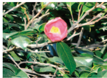
市指定重要文化財のツバキ