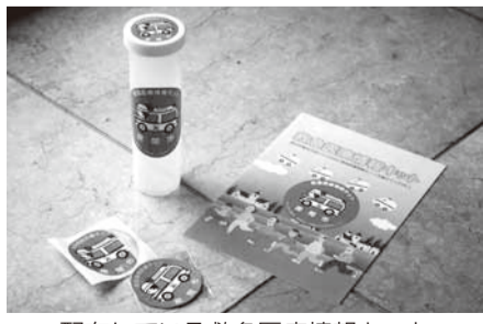
配布している救急医療情報キット