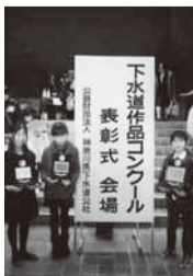
表彰式に出席 した皆さん

今回は、総数4150点 (作文の部85点、ポスター の部750点、書道の部3 15点)の応募があり、 市からは次の皆さんが入賞 しました(敬称略)。