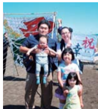
ミニ凧を受け取る家族

○受取方法 当選はがきと代金を持参し、5月4日（木）・5日（金）午前10時～午後3時に、大凧まつり会場（座架依橋北側）本部隣の受け渡しテントへ