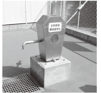
災害時用手押しポンプ