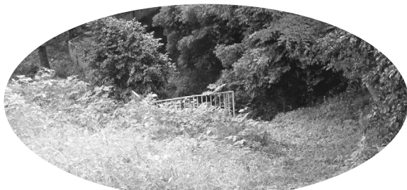
鷹番塚横穴墓群(遺跡公園)

ぐ、市内で2番目に広い公 園です。かながわの公園50 選にも選ばれています。3 月30日(木)に整備工事が 完了し(1面参照)、全園 開園となります。芝生広場