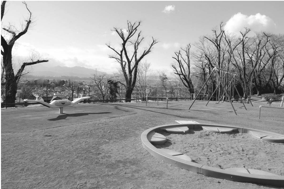
高台からの眺めは絶景(座間公園)

「鷹番塚横穴墓群」とい う遺跡の上にある公園です。 大きさが異なる大小の滑り 台がついた複合遊具があり、 小さい子でも遊ぶことがで きます。