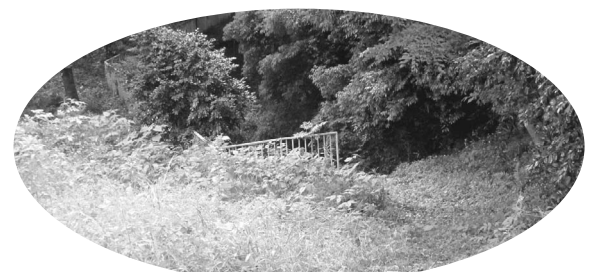
鷹番塚横穴墓群(遺跡公園)

や遊具コーナーが人気です。 新たに開園するエリアには、 全長約50メー トルのローラ ー滑り台が設 置されていま す。