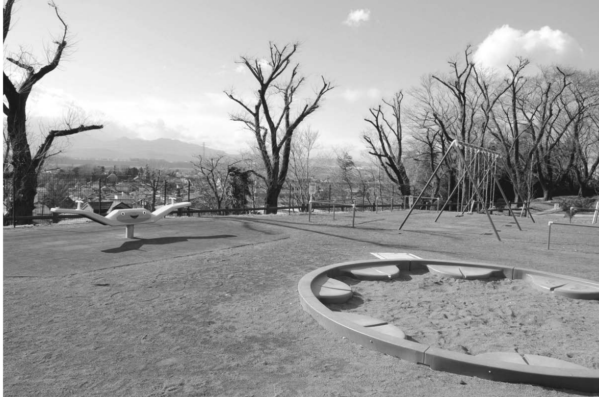
高台からの眺めは絶景(座間公園)

スカイアリーナ座間(市 民体育館)に隣接していま す。公園の敷地全体が傾斜 しているので、上り下りを 楽しみながら散歩ができま す。展望台からの眺めがお すすめです。