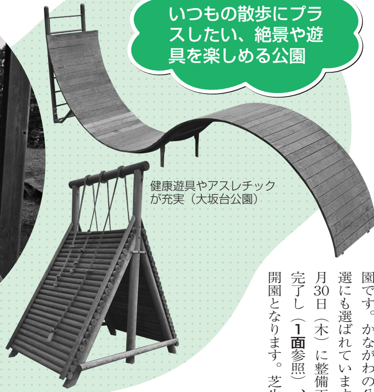
健康遊具やアスレチック が充実(大坂台公園)