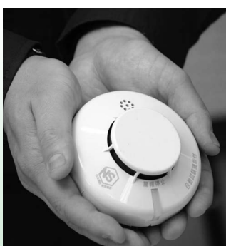
一般的な住宅用火災警報器

住宅用火災警報器は、煙や熱を感知して火災の発生を警報音や音声により知らせるものです。しかし、古くなると電池切れなどで、火災を感知しなくなることがあり、危険です。10年を目安に交換をお勧めします。火災警報器は、消防設備取扱店の他、電気店やホームセンターなどでも取り扱っていますので、早めに交換をしてください。設置の基準など詳しくは担当へお問い合わせください。