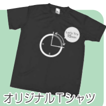
オリジナルTシャツ